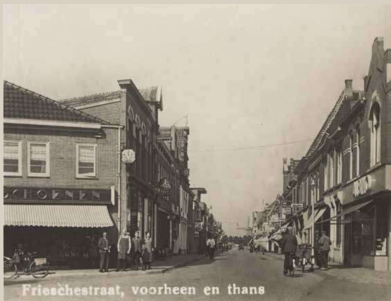
Frieschestraat, voorheen en thans