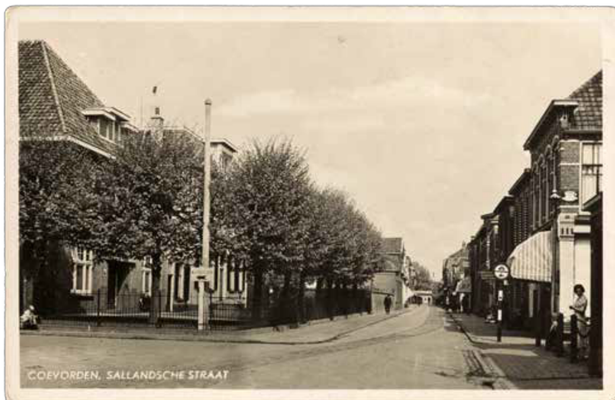
Fig. 1. Een ansichtkaart van de Sallandsestraat kort na de oorlog. In deze straat woonden relatief veel Joden. (Drents Archief, fotocollectie Drents Museum).

In augustus 1941 schreef de bezetter Verordening 154/1941 uit. Deze was van toepassing op Joodse winkels en woonhuizen. Deze verordening hield in dat Joodse eigenaren vóór 15 september 1941 hun onroerend goed moesten melden. Vervolgens kwamen de panden onder het beheer van de hiervoor opgerichte stichting Niederländische Grundstücksverwaltung (NGV). 12 Tot de taken van de NGV behoorden het beheren, verhuren, met hypotheek bezwaren en geheel of gedeeltelijk verkopen van dit onroerend goed, evenals de mogelijkheid deze bevoegdheden aan anderen over te dragen. 13 Op initiatief van een aantal Duitsgezinde makelaars werd tegelijk een Nederlandse organisatie opgericht die het beheer en de verkoop moest stimuleren. 14 Dit was de stichting Algemeen Nederlands Beheer van Onroerende Goederen (ANBO). Deze stichting, die in Den Haag was gevestigd, opende kantoren in verschillende steden, onder meer in Groningen en Almelo. De verwachting was dat een lokale ANBO de panden van Joodse eigenaren gemakkelijker kon verkopen. Voor Joodse bedrijven kwamen vergelijkbare verordeningen en kon een Duits accountantskantoor, OMNIA Treuhandgesellschaft genaamd, het beheer voeren en tot verkoop overgaan. 15 De onderbeheerstelling van panden werd in de loop van 1942 aangetekend in de openbare kadastrale leggers. De kadasterkantoren in Nederland deden dit op verschillende manieren. Het kantoor dat dit bijhield voor Coevorden en omgeving deed het met kleine letters in de marge.