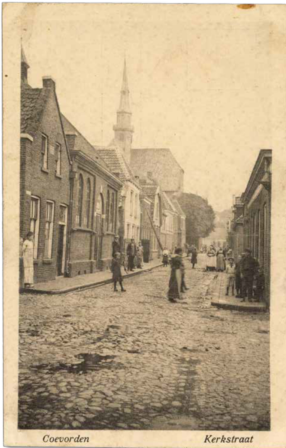
Fig. 4. De Kerkstraat met geheel links de woning van de rabbijn en daarnaast de synagoge op een ansichtkaart, ca. 1920-1930. De eigendommen van de Joodse gemeente bleven onverkocht, maar de panden werden wel gebruikt en verhuurd.