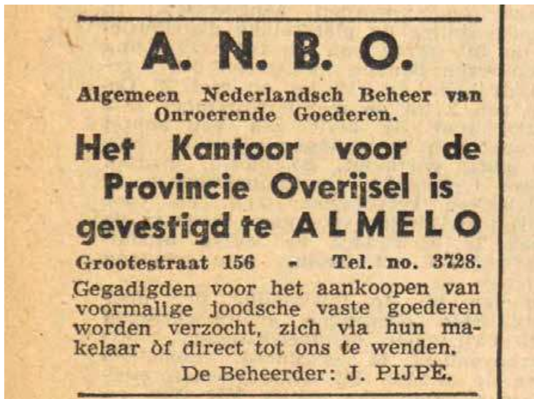
Fig. 7. Advertentie van de ANBO, kantoor Almelo, uit De Koerier , 20 oktober 1942. In veel delen van Nederland bleef de belangstelling voor de aankoop van panden van Joodse eigenaren beperkt.