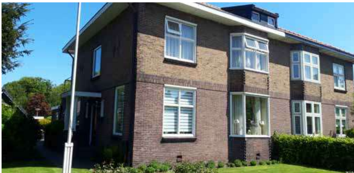
Fig. 5. De Van Heutszsingel 45 in 2022, het pand waar de weduwe Estella Meiboom-Hompes met haar dochter Mietje woonde. Overdracht van het pand aan de oorlogskoper vond plaats op 19 maart 1943 bij notaris Van Veen.

aard onbekend. Na de bevrijding zou haar zuiver vermogen worden geschat rond de 120 duizend gulden, waarvan 114 duizend aan onroerend goed. 38