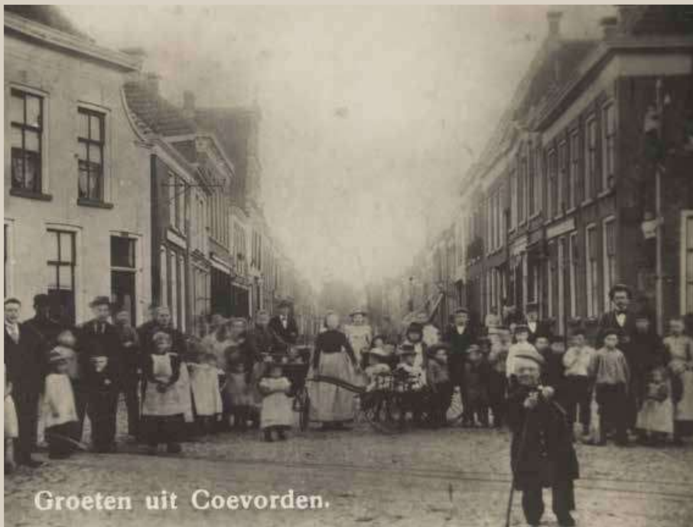
Groeten uit Coevorden.