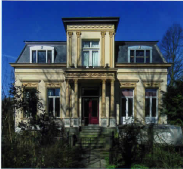
Vanaf 1934 tot eind 1945 was de villa Zuiderpark 2 de officiële burgemeesterswoning van de gemeente Groningen geweest.

functioneerden de eerste maanden na de bevrijding ook informele wijk-woningcomités waarin leden van het verzet en binnenlandse strijdkrachten actief waren. Uit hun huis gezette spoorwegstakers en mensen uit de illegaliteit werden langs deze weg onder dak gebracht, vaak in woningen van NSB-ers. 11