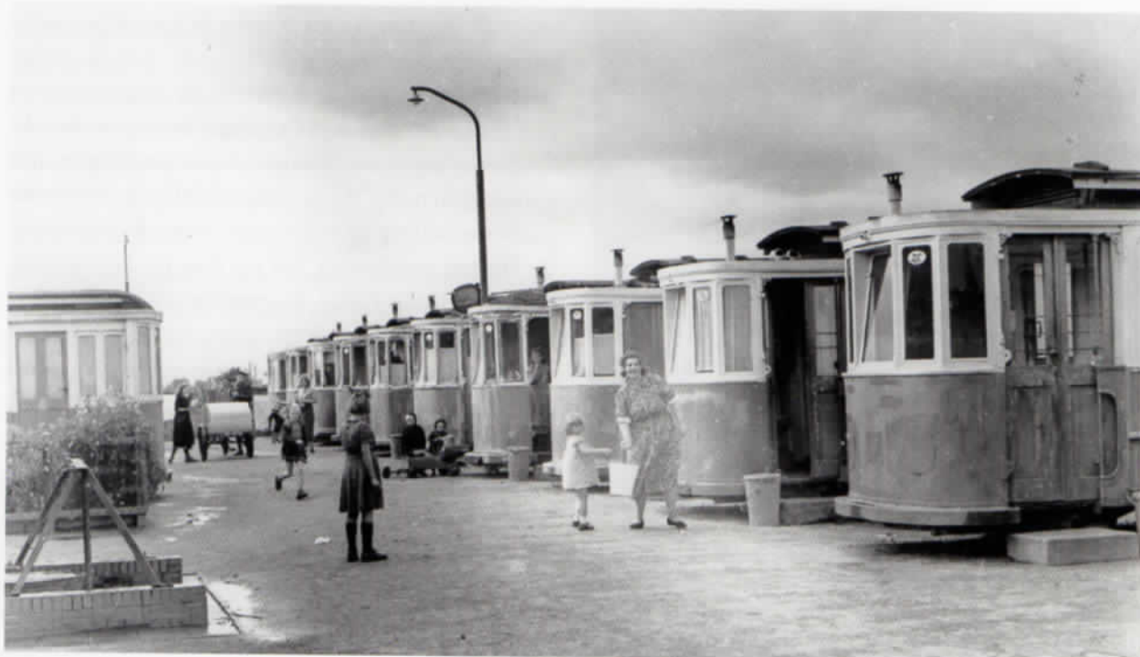
Tramdorp, even over het spoor bij de Friesestraatweg, was na de oorlog hét symbool voor de woningnood.